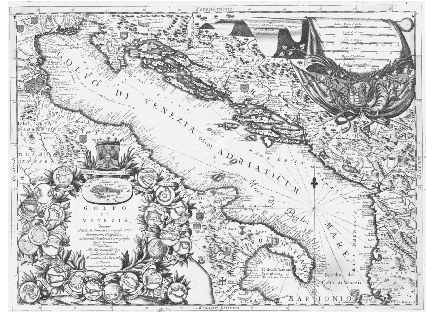
(Vincenzo Coronelli, Golfo di Venezia, 1688)