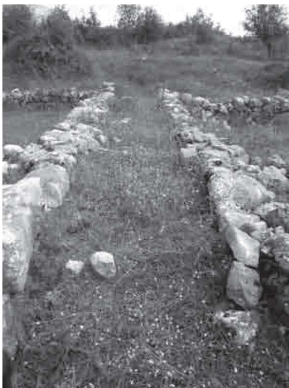
Fig. 14. L' ambitus tra le case 5 e 6 di Antigonea

causa della conformazione del terreno digradante da est verso ovest. Gli isolati presentano così un fronte di 15 m ed ospitano un'unica abitazione nel senso della larghezza 36 .