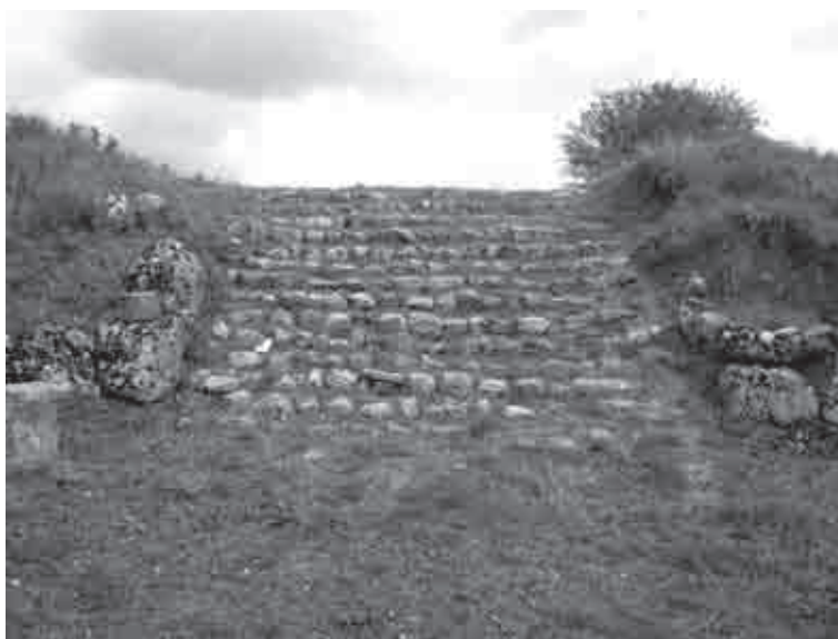
Fig. 17. La scalinata nel tratto orientale della strada (b)

L' agorà è collocata sempre in una posizione di rilevanza all'interno dello spazio cittadino, spesso in un'area più elevata o comunque in stretta vicinanza o in collegamento diretto con gli ingressi principali anche quando, come nei casi di Cassope ed Antigonèa, è situata in un settore apparentemente marginale del centro urbano. L'orientamento, la disposizione e la dimensione della piazza variano a seconda delle situazioni contingenti interne a ogni città. Ad Antigonèa è molto allungata e sembra presentare il lato maggiore su una via minore (strada b) e il lato breve su quella principale (strada a) 40 ; la piazza di Elea mostra una forma praticamente quadrata ed occupa una superficie di 3.000