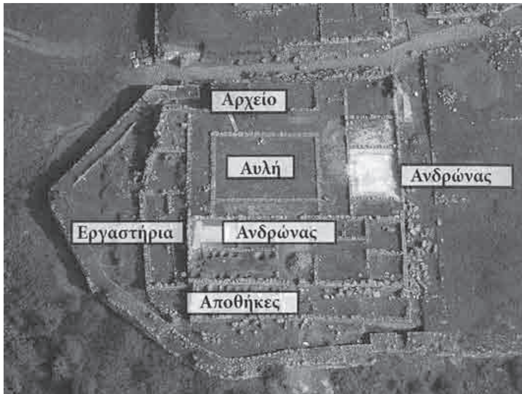
Fig. 21. Il prytanèion -archivio della città (da Kanta-Kitsou 2008: 55)

disposte all'interno delle insulae su due file, quando gli isolati sono attraversati dagli ambitus centrali. Il numero di queste varia a seconda della disponibilità di spazio e solo nel caso di Cassope, grazie ai numerosi scavi archeologici, si è riusciti a determinare con un buon grado di certezza il loro numero all'interno della fascia centrale di isolati 45 . La larghezza delle case è pressoché costante nelle diverse città, dai 14,4 ai 18 m ca., disposte in isolati che variano dai 30 ai 36 m ca., ad eccezione del caso di Antigonea, che presenta anche insulae con un fronte di 50 m ca.; tutti questi valori derivano sicuramente dalla tradizione dell'agrimensura greca.