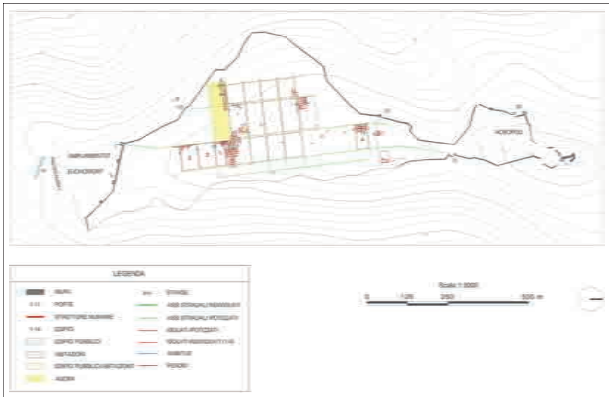
Fig. 13. Pianta di Antigonèa (elaborazione dell'Autore)

avvicina molto a quella delle città ortogonali sorte tra l'età arcaica e tardo-classica in Epiro e in Illiria meridionale, come ad esempio Apollonia, Ambracia, Cassope e Gitana 35 .