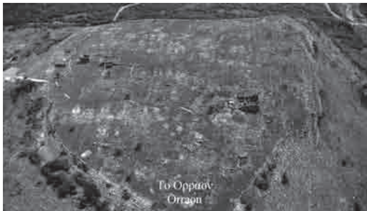
Fig. 2. Il pianoro su cui sorge Orraon

le sue fortificazioni e in riferimento al momento di forte crescita politica e militare della tribù dei Molossi all'interno della regione epirota, in un periodo in cui al potere vi era il re Alceta (385-370 a.C.) (Dakaris et alii 1976: 432; Dakaris 1986: 118-119; Papachristodoulou et alii 2011: 792). Data la posizione strategica e le imponenti fortificazioni che racchiudono un'area di poco più di 5 ettari, la città deve essere stata pianificata con una precisa funzione militare di controllo della pianura a nord di Ambracia, del territorio molosso e delle due vie di collegamento principali tra il golfo d'Ambracia e l'Epiro centrale, attraverso la valle del fiume Louros , antico Αφας , e quella del fiume Arachthos (Dakaris 1986: 108-111; Dausse 2007: 208, 210). Ruolo strategico che ha ricoperto per tutto il suo periodo di vita, come attestato anche dal fatto di essere tra i quattro centri molossi che nel 168 a.C. non si erano ancora consegnati ai romani ( Passaron , Tecmon , Phylake e Horreum ) (Liv. XLV 26, 4) e che si arresero solo in un secondo momento sotto l'assedio delle truppe del console L. Anicio (Liv. XLV 26, 10).