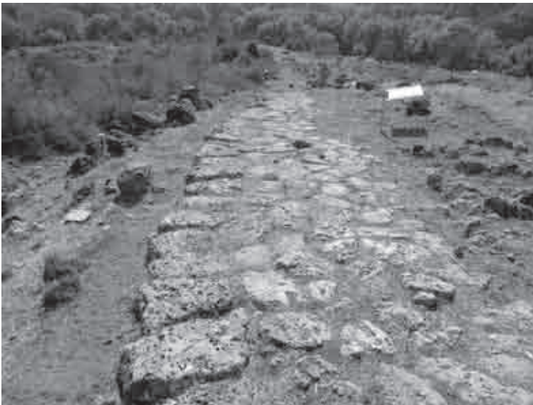
Fig. 15. Pavimentazione in lastre di pietra della strada (o) di Gitana