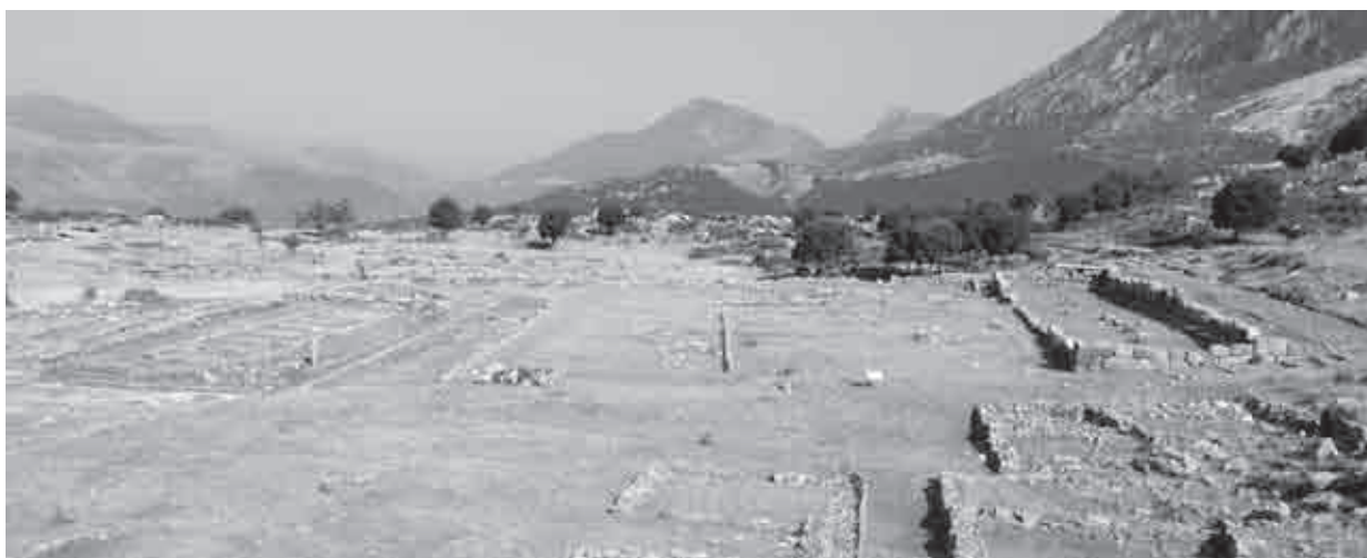
Fig. 20. L'agorà di Elea posta su tre livelli diversi

Sempre a Gitana, l'edificio 7 (la probabile zecca; anche noto come edificio B o 1) (Gania 2006: 180; Kanta-Kitsou 2008: 52) e l'edificio 5 (il cosiddetto prytanèion -archivio, o edificio A o 32) (Preka-Alexandri 1993; Kanta-Kitsou 2008: 55-59) si trovano lungo due dei pochissimi tracciati lastricati della città (m, k) (fig. 21). A Elea, in maniera analoga, l'edificio 12 (forse sede degli agoranómoi ) (Riginos 1992: 354-355; 1999: 171; Riginos, Lazari 2007a: 51-53) è localizzato in un punto periferico della città, ma nello stesso tempo in stretto collegamento con il centro cittadino, grazie alla strada principale (a).