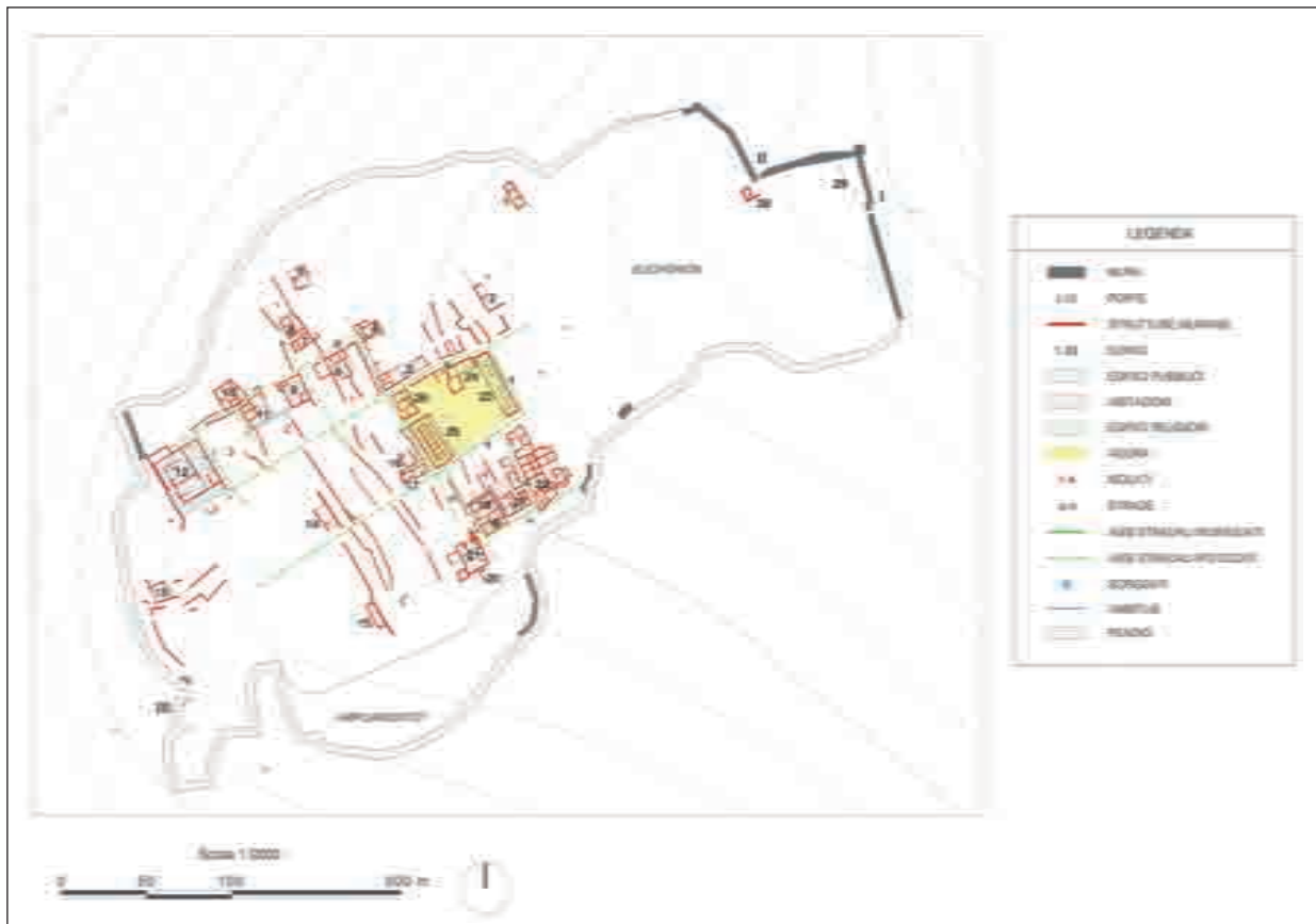
Fig. 12. Pianta di Elea (elaborazione dell'Autore)

partizione”, che, a parte nell’area dell’ agorà , non è mai stato oggetto di una adeguata analisi e di un preciso rilievo archeologico 31 . L’unica planimetria che riporta gli edifici e le strade individuate su tutta l’estensione della città è stata pubblicata per la prima volta da S. Dakaris nel 1972, e successivamente riproposta nel 1987 e nel 1989 (Dakaris 1987: 77; Preka-Alexandri 1989: 303). Nel centro urbano di Gitana ricoprono un ruolo di primaria importanza le due strade maggiori est-ovest (a-p, f) 32 , larghe