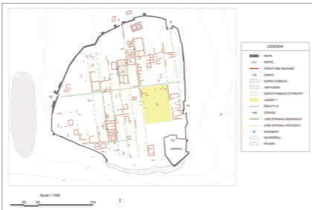
Fig. 10. Pianta di Orraon (elaborazione dell'Autore)

in ogni isolato. Non è un caso che la parte centrale delle città, quella modulata sulla parte di terreno più pianeggiante e più distante dalla cortina muraria, sia quella caratterizzata dalla maggiore lunghezza delle insulae : 89-90 m a Orraon, 126-128 m ca. a Cassope, 72-74 m a Gitana, 100 m ca. ad Antigonea. La griglia stradale è completata dalle vie perpendicolari a quelle maggiori. Larghe tra i 3 e i 5 m ca., si dispongono a distanze più o meno costanti determinando la larghezza e il numero delle insulae che potevano essere ulteriormente divise nel senso della larghezza da stretti vicoli che garantivano una migliore viabilità e comunicazione tra i diversi settori della città.