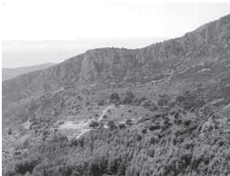
Fig. 4. Il pianoro su cui sorge Cassope (da Andréou 1997: 101)