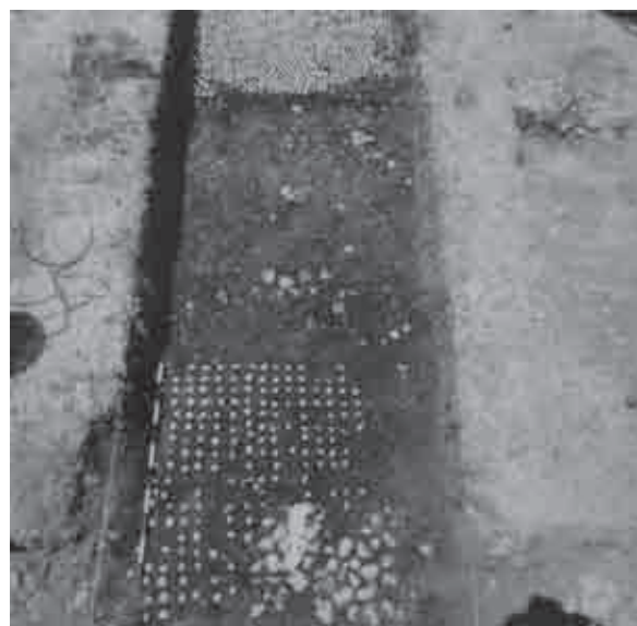
Fig. 18. Il piano pavimentale dell'edificio al di sotto della stoà nord (Hoepfner et alii 1994: 136)

mq ca., collocata al centro circa dell'abitato; l' agorà di Gitana, posizionata ai piedi della collina di Vrysella, è delimitata sul lato lungo da una delle strade principali (strada p), posteriore al complesso di negozi, occupando la larghezza di 3 isolati, comprese le strade che li separano (112 m ca.), senza contare i probabili edifici che la delimitavano sui lati brevi; a Cassope la piazza è fiancheggiata a nord dall'asse stradale maggiore ed è lunga 4 isolati, compresi gli edifici pubblici a fianco delle strade minori che ne delimitano i lati corti, come il prytanèion a ovest e il c.d. bouleutèrion-odèion a est