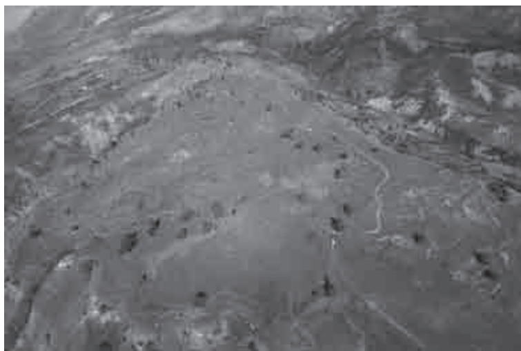
Fig. 6. Il pianoro su cui sorge Antigonea visto da sud (da Çondi 2014: 241)

Infine, all'inizio del III sec. a.C. si datano i resti monumentali della città di Antigonea, l'unica tra quelle prese in esame che mostra una netta organizzazione dello spazio urbano in piena età ellenistica 19 . La città, individuata per la prima volta da Dh. Budina grazie al rinvenimento di 14 tessere bronzee con la scritta ANTIGONEΩΝ (Budina 1987b: 159; Pediglieri 2012: 39), è situata su due colline, sul versante meridionale del monte Lunxhëria, sulla destra idrografica del fiume Drinos, presso il villaggio di Saraqinishtë. Il centro urbano si organizza su due creste separate da uno stretto passaggio; a nord si trova la collina di San Michele a 686 m s.l.m., a meridione la collina di Jermë a 642,5 m s.l.m., caratterizzata dalla successione di terrazzi naturali e artificiali (fig. 6). Le indagini archeologiche, tuttora in corso, hanno identificato gran parte del circuito murario che racchiudeva uno spazio urbano di circa 35 ettari e diverse abitazioni e assi stradali 20 . Le fonti anti-