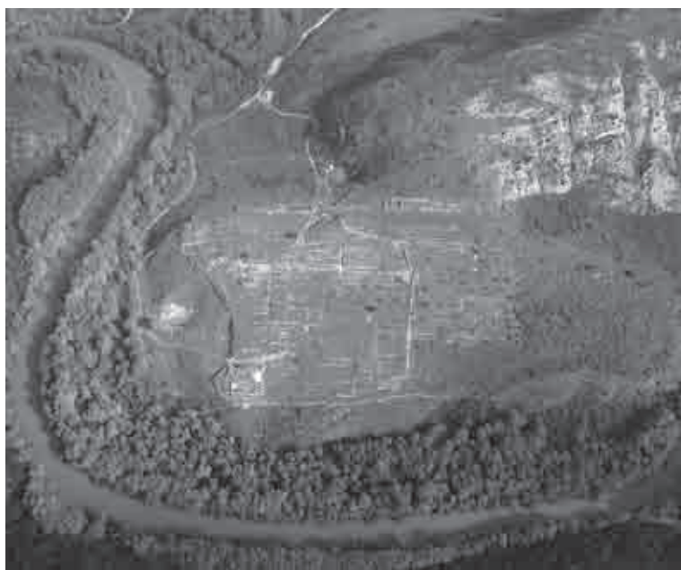
Fig. 5. Immagine aerea di Gitana e del fiume Kalamas (da Kanta-Kitsou 2008: 18)

età preistorica all'interno del katagògion e qualche frammento di ceramica a vernice nera associata a ceramica locale non tornita rinvenuta in un piccolo sondaggio nella casa 5 attestano una frequentazione del sito precedente alla grande fase di crescita urbana (Dakaris 1979: 116-117; 1980: 28-32; 1981: 75-77). Date le caratteristiche del pianoro adatte all'insediamento è probabile che il sito fosse sede di un villaggio e che questa kome sia stata scelta tra le altre sparse nel territorio e caratterizzata in senso urbano, per diventare il centro politico-amministrativo principale dei Cassopei. È possibile che questa kome svolgesse un ruolo di rappresentanza all'interno della tribù, che potrebbe essere testimoniato dall'inserimento del centro nella lista theorodokoi di Epidauro datata al 365-359 a.C. (IG IV 2 1, 95, l. 25).