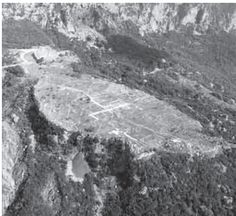
Fig. 3. Il pianoro su cui sorge Elea visto da nord-ovest (da Riginos, Lazari 2007a: 8)

Cassope è sicuramente, tra le città dell'Epiro, quella meglio studiata e nota; questo grazie alla sua estensione, circa 40 ettari, alla monumentalità dei suoi resti architettonici e ai numerosi scavi archeologici condotti dall' équipe greco-tedesca sin dai primi anni '50 del secolo scorso 15 . La città si trova su un altopiano, ad un'altitudine tra i 550 ed i 650 m s.l.m. da sud verso nord, lungo le pendici occidentali del Monte Zalongo (774 m s.l.m.), nei pressi del villaggio moderno di Camarina (prefettura moderna di Preveza) (fig. 4). La genesi di Cassope, che si organizza sin dall'inizio come il principale centro amministrativo, politico, religioso ed economico dei Cassopei, è attestata archeologicamente intorno alla metà del IV sec. a.C. e non oltre la fine del secolo; è in questo periodo che si datano infatti le prime fasi delle abitazioni e l'impianto ortogonale della città con l' agorà , gli edifici pubblici più antichi e le iscrizioni. Non sembra infondata l'idea di N. Hammond (Hammond 1967: 553-554) che attribuisce la definizione in senso urbano di Cassope, con la progettazione delle fortificazioni e dell'impianto urbano, alla con-