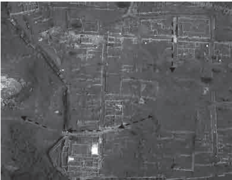
Fig. 16. Percorso dalla porta I al teatro di Gitana (elaborazione dell'Autore da Kanta-Kitsou 2008: 38)

e ben definita suddivisione funzionale e razionale dello spazio urbano. Le città epirote tra il III e l'inizio del II sec. a.C., in un periodo di prosperità economica e politica, coincidente con l'istituzione del regno epirota sotto la dinastia eacide e, successivamente, con la costituzione del koinon degli Epiroti (232-167 a.C.), sono interessate da una forte crescita monumentale degli edifici pubblici, che si inseriscono perfettamente all'interno dell'impianto urbano e da un'estensione del proprio spazio civico legato a un probabile incremento demogra-