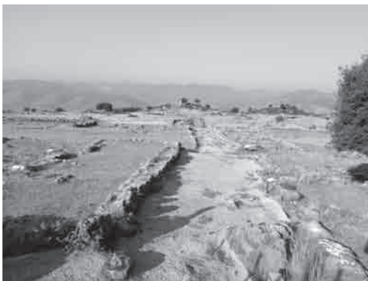
Fig. 11. La strada (a) di Elea vista da est

La città di Cassope mostra un sistema urbano non solo ortogonale, ma chiaramente regolare. La forma allungata e sostanzialmente pianeggiante dell'altopiano su cui sorge la città, orientato in senso est-ovest, ha portato ad impostare la griglia