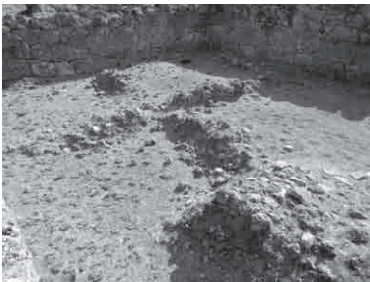
Fig. 7. Resti di strutture al di sotto dell'edificio 2 di Gitana

A Cassope non si riscontrano queste problematiche, dal momento che le ricerche effettuate, sia nei percorsi stradali che all'interno delle abitazioni delle insulae , mostrano chiaramente la presenza di un piano urbano regolare almeno nella seconda metà del IV sec. a.C., mentre i resti di frequentazione sporadici rinvenuti sul pianoro possono essere attribuiti alla presenza di un villaggio preesistente. Dinamiche simili sembrano essersi verificate anche ad Elea, che mostra tracce di frequentazione precedenti la formazione del centro urbano, e a Orraon, che presenta invece una situazione più sfuggente dal punto di vista del dato archeologico. Qui, in particolare, le ricerche sembrano testimoniare una fase di crescita della città, attribuita alla politica del re Pirro all'inizio del III sec. a.C., visibile nel rafforzamento delle mura, che raggiungono uno spessore tra i 2,7 e i 3,6 m e vengono protette da otto torri rettangolari 25 . Non è noto archeologicamente se l'intervento di Pirro abbia prodotto un'eventuale riorganizzazione dello spazio urbano, che porterebbe a datare in questo periodo le tracce visibili dell'impianto ortogonale, ma è logico pensare all'impostazione di una precisa suddivisione dello spazio cittadino