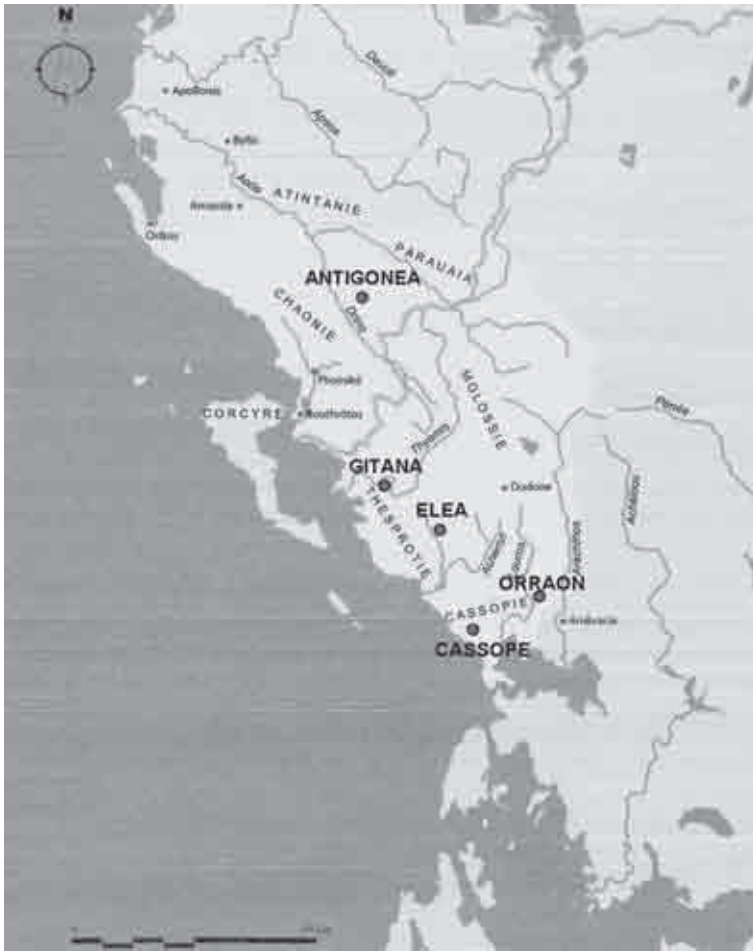
Fig. 1. Localizzazione delle città prese in esame (pianta dei confini iliro-epiroti alla fine del IV sec. a.C., da Cabanes 2010: 139, elaborata dall'Autore)

tazione del dato archeologico (anche con l'ausilio di documentazione grafica e fotografica e di immagini satellitari) e quindi sull'analisi di ogni singolo aspetto delle città antiche, tenendo presente la grande diversità delle situazioni storiche e geografiche nella quale si sviluppano, ha portato a proposte ricostruttive, che giudico innovative, del loro impianto urbano, evitando schematizzazioni e riproposizioni troppo rigide e regolari della griglia urbana, il più delle volte dettate dalla semplificazione del dato archeologico e dai preconcetti riguardanti le caratteristiche tipiche degli impianti ortogonali. Tutto questo ha permesso anche di realizzare nuove e più dettagliate piante urbane, elaborate con software di grafica vettoriale (AutoCAD 2012) 4 . L'analisi storica, po-