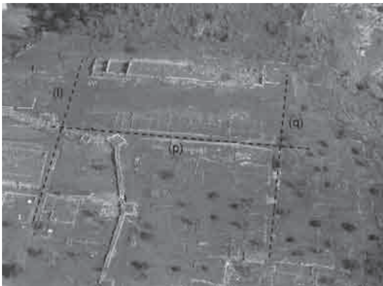
Fig. 19. L'agorà di Gitana tra le strade (l, p, q) (elaborazione dell'Autore da Kanta-Kitsou 2008: 44).

(140 m ca.). Mentre i lati lunghi delle piazze sono sempre definiti da un asse stradale posto alle spalle di stoai o di una serie di botteghe o magazzini ecc., i lati brevi sono delimitati dai percorsi che entrano all'interno dell' agorà , racchiudendo lo spazio aperto della piazza, anche se il più delle volte presentano alle spalle un edificio pubblico, come nei casi del prytanèion di Cassope, e forse anche a Gitana ed Antigonea 41 . Probabilmente solo a Elea gli assi stradali circoscrivevano completamente lo spazio dell' agorà compreso delle stoai che ne costituivano il perimetro. Una caratteristica essenziale dell' agorai di queste città è quella di costituire, almeno dal pieno III sec. a.C., un insieme architettonico chiuso, con edifici come le stoai che costituiscono gli elementi architettonici che inquadrano, adattandosi perfettamente alla morfologia del terreno, lo spazio aperto dell' agorà e si dispongono parallelamente alla rete stradale. A Orraon non è mai stato identificato con esattezza lo spazio dell' agorà , tanto che si è spesso ritenuto che essa non fosse presente dato il ruolo esclusivamente difensivo di questo insediamento fortificato (Martin 1979: 437; Dakaris 1986: 115). La mancanza di evidenti